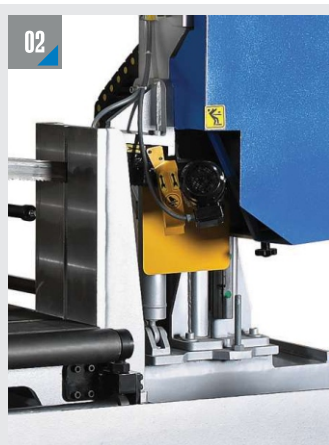
ПРИВОДНАЯ ЩЕТКА ДЛЯ ОЧИСТКИ ПОЛОТНА