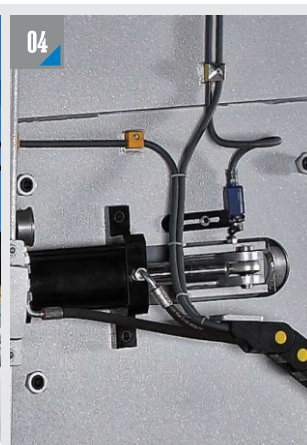
АВТОМАТИЧЕСКОЕ НАТЯЖЕНИЕ ПОЛОТНА