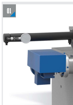
ГИДРАВЛИЧЕСКИЙ ЗАЖИМ ЗАГОТОВКИ