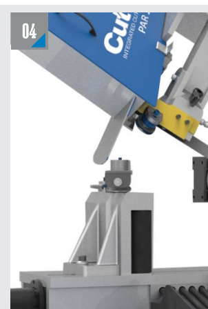
НАДЕЖНЫЙ КОНТРОЛЬ ДЛИНЫ ЗАГОТОВКИ